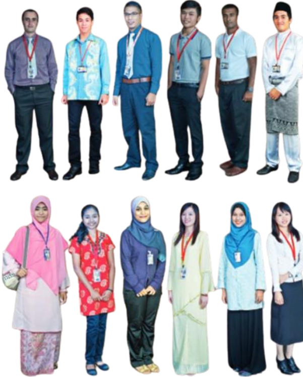
Contoh Pemakaian Pelajar Lelaki dan Perempuan